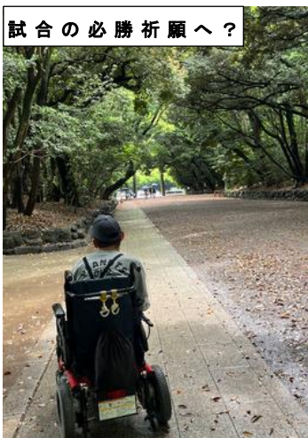
試合の必勝祈願へ？

小雨のため、この後、観光には行かず2軍観戦。(野球がお好きな気持ちで観戦。有名選手を間近に見られて喜んでいらつしやいました。)