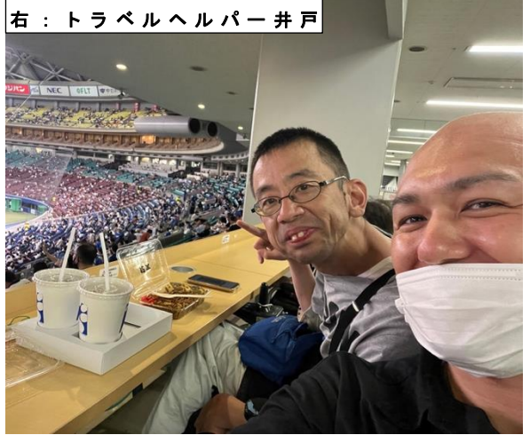
右：トラベルヘルパー井戸

最終日も、大須商店街や大須観音を観光して、大好きな横浜 DeNA ベイスターズの試合観戦を楽しみ、お墓参りをして、無事ご帰宅されました。