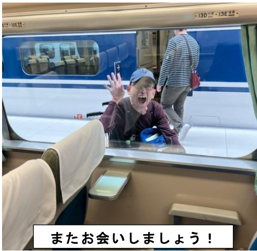
またお会いしましょう！

最終日も、大須商店街や大須観音を観光して、大好きな横浜 DeNA ベイスターズの試合観戦を楽しみ、お墓参りをして、無事ご帰宅されました。