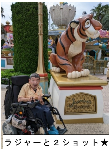
ラジャーと2ショット★

写真をみていると行きたくありません！初めてのデイズニーシーは、いかがでしたでしょうか。